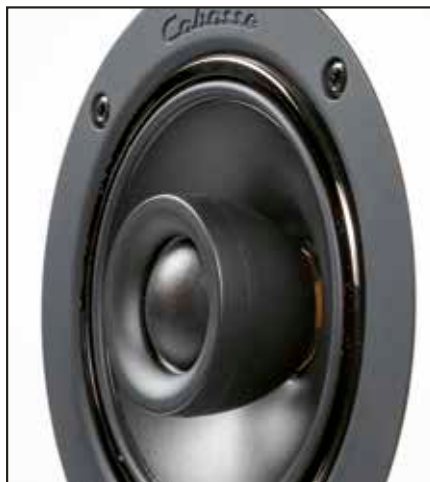
▲ Auch beim Thema Koax-Lautsprecher gibt es zahlreiche Varianten – wie diese von Cabasse.

damit man auch jenseits des „Sweet Spots“ möglichst viel der akustischen Feinheiten übermittelt bekommt. Um die Antigua mit etwas mehr Fundament auszustatten und ihr zugleich eine höhere Pegelfestigkeit zu verleihen, findet sich unterhalb des Koax-Chassis ein 17 cm messendes, langhubiges Basschassis mit aufwendiger, ventilerter Capton-Schwingspule, die für