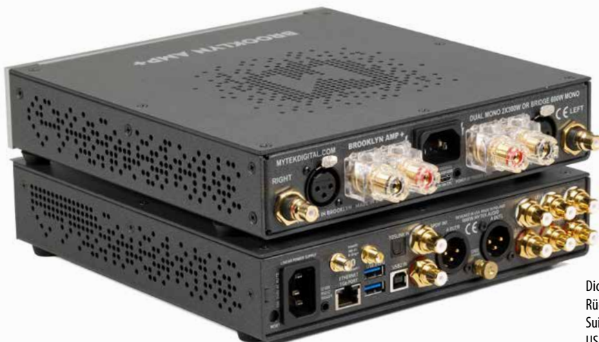
Dicht gepackt (!): Auf dem kompakten Rückenpanel findet sich eine ordentliche Suite an Anschlüssen von RCA über XLR und USB bis hin zu optischen Eingängen.

Sektionen ausgeführt“, betont Dirk Brieden von Audio Trade. „Die Technik ist mittlerweile so weit, dass sich das auf engstem Raum verwirklichen lässt – und zwar highend.“