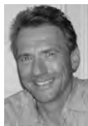
von Robert Schmitz-Niehaus

Geht es um eine Entschleunigung und eine Zäsur im Alltag, dann ist die Schallplatte immer noch das Mittel der Wahl. Besonders gut lässt sie sich natürlich mit einer edlen MC-Phonovorstufe in Doppelmono-Bauweise wie der Surzur von Blue Amp genießen. Diese gibt es inzwischen in der MK II-Version und sie soll laut Hersteller klanglich hörbar zugelegt haben.