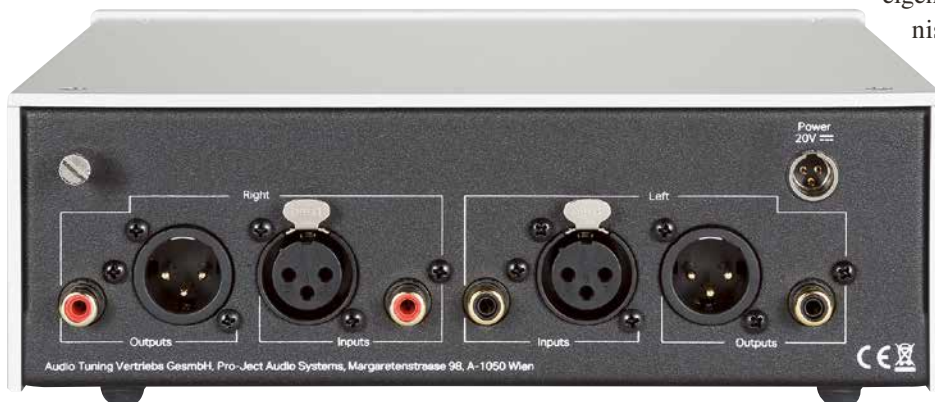
Symmetrische Ein- und Ausgänge sind in dieser Preisklasse eine absolute Ausnahme.

Bei uns ging es weiter mit Jimi Hendrix und dem Album „Electric Ladyland“. Keine audiophile Perle, aber ein eindrückliches Beispiel für musikalische Leidenschaft. Und Energie. Und die Fähigkeit, schwierigste Dinge wie selbstverständlich erklingen zu lassen. Wenn nichts weggelassen oder verschliffen und die Dynamik transportiert wird, entsteht vor dem Zuhörer ein Mikrokosmos, dessen Faszination er kaum entkommen kann. Die kleine Kiste mit den zahlreichen LEDs und noch mehr Anpassungsmöglichkeiten liefert all diese Fähigkeiten so gut wie ansatzlos, hält sich mit einer eigenen Meinung zu den Geschehnissen dabei erfreulich zurück und vollbringt zugleich das Kunststück, es dabei durch ein hohes, wenn auch nicht